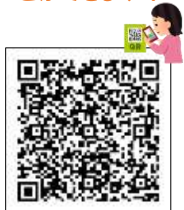
ともコミュ通信第7号