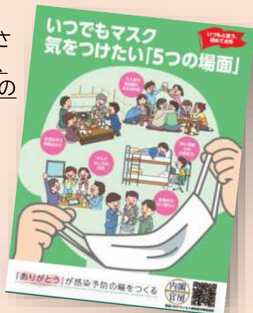
新型コロナウイルス感染対策推進室ポスターより

『新型コロナウイルス』は、症状がない感染者でも感染させるのが特徴です。 “公共の場”におけるマスクの着用は、感染拡大防止に効果があり、適切に着用することで飛沫の拡散を予防できます。 こまめな手洗い・定期的な換気・ソーシャルディスタンスの確保を！(担当保健師)