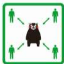
くっつかないモン #KeepDistance